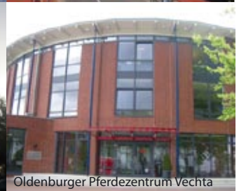
Oldenburger Pferdezentrum Vechta