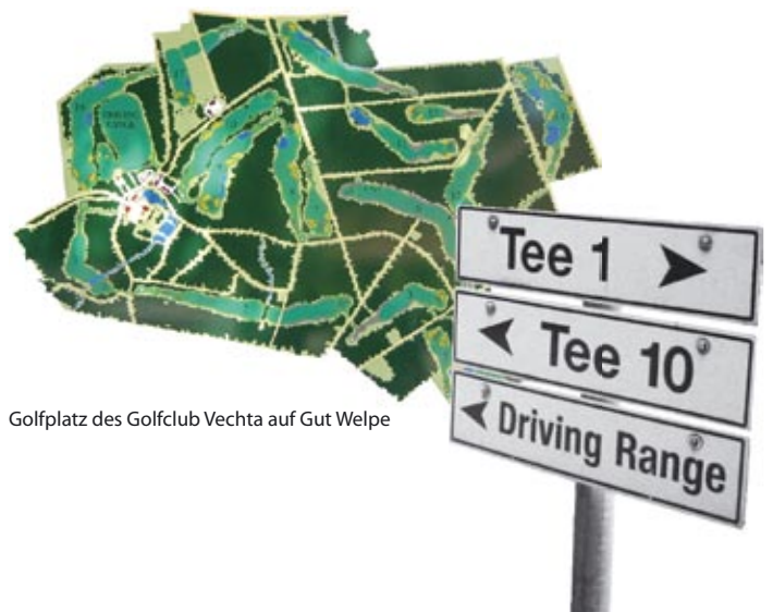
Golfplatz des Golfclub Vechta auf Gut Welppe

Der Standort verfügt insgesamt über ein positives Image . Für Naherholungssuchende, Golfer, Restaurant- und Café-Besucher und Einwohner aus Vechta und der weiteren Region ist der Standort ein Begriff. Gebäude und Umfeld inkl. Teichanlage im Grünen werden als hochwertig und ansprechend wahrgenommen.