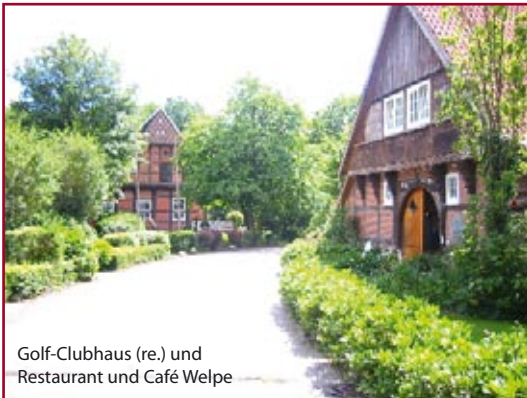
Golf-Clubhaus (re.) und Restaurant und Café Welppe