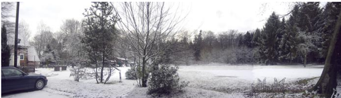
Standort für das Waldhotel Welpen

Diesem hohen Anspruch wird der vorgesehene Standort gerecht. Die beabsichtigten Festsetzungen des Bebauungsplanes bieten Gewähr dafür, dass die künftigen Baukörper sich harmonisch einfügen und die positive Wirkung des Ensembles erhalten bleibt.