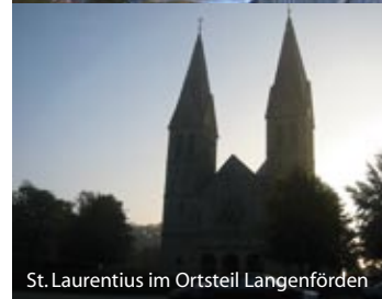
St. Laurentius im Ortsteil Langenförden