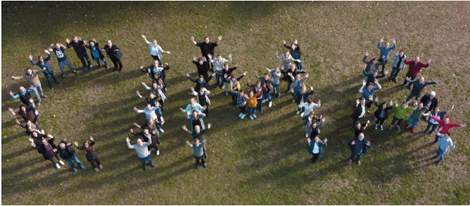
Die CIMA Beratung + Management GmbH feiert ihr 30-jähriges Bestehen.