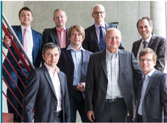
Leitende Mitarbeiter gründen die Partnergesellschaft