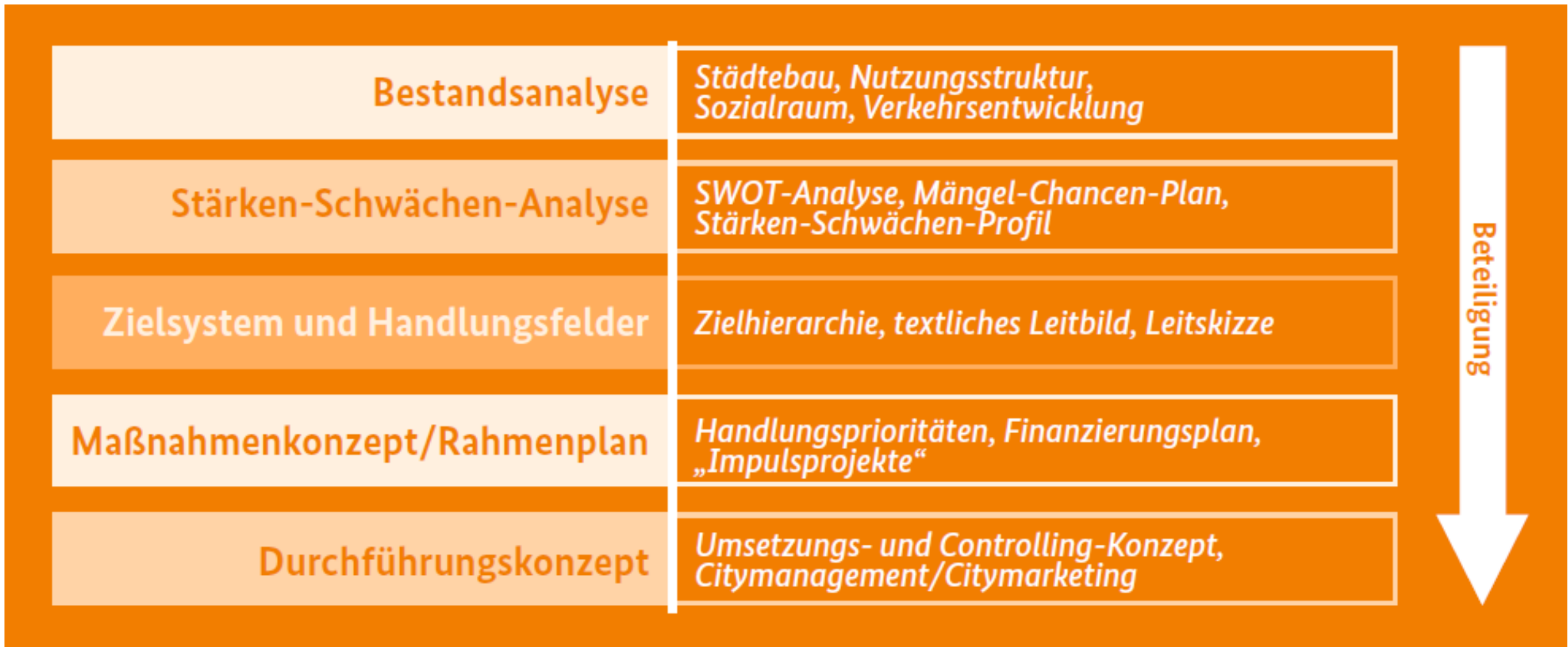
BMVBS 2015: Integrierte städtebauliche Entwicklungskonzepte in der Städtebauförderung