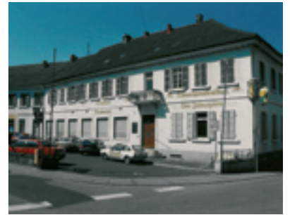
Ehemalige Winzergenossenschaft Kaiserlauterer Straße 1 (vorher/nachher): Jahrelanger Leerstand und Schandfleck der Stadt – heute durch Tanzschule und Gastronomieumsetzung Treffpunkt für alle Generationen

Nachdem die einmalige Kapitaleinlage des Wettbewerbspreisgeldes seitens des Landes nicht möglich war, werden die Fördermittel derzeit analog zum Landesprogramm „Städtebauliche Erneuerung“